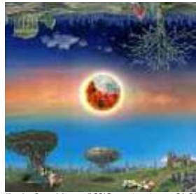
"Le due facce del tempo" 2018 - tecnica mista cm 94x94

del sapere artistico, partendo dall'elaborazione grafica del bozzetto fino ad arrivare alle sperimentazioni tecniche contemporanee che prevedono la commissione dell'utilizzo di chine, acrilici, pennarelli, pastelli ed ecoline con le più sofisticate tecniche digitali, qualificando così la sua indagine artistica come un'innovazione nel panorama artistico odierno". Per Fortunato D'Amico, "Nell'anno dedicato a Dante Alighieri, padre della lingua italiana, autore di modelli letterari diventati la matrice di tutte quelle