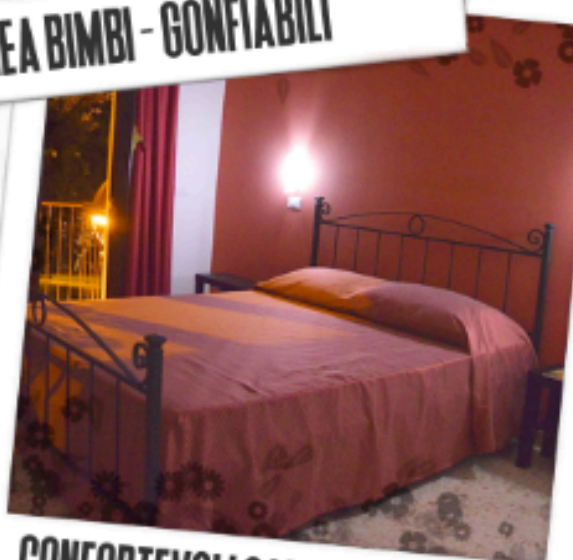
CONFORTEVOLI CAMERE D'ALBERGO