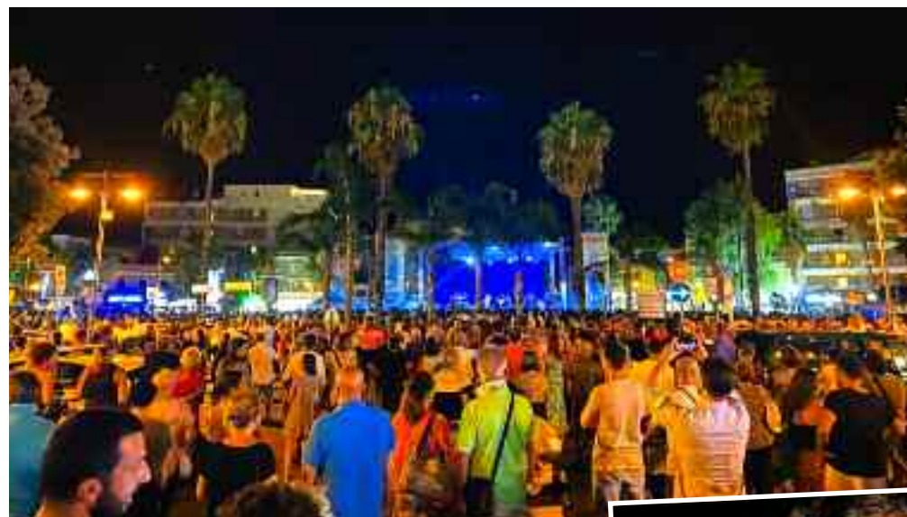
mettono a disposizione della col-

Qual è stato l'appuntamento di questa estate che le ha dato mag-