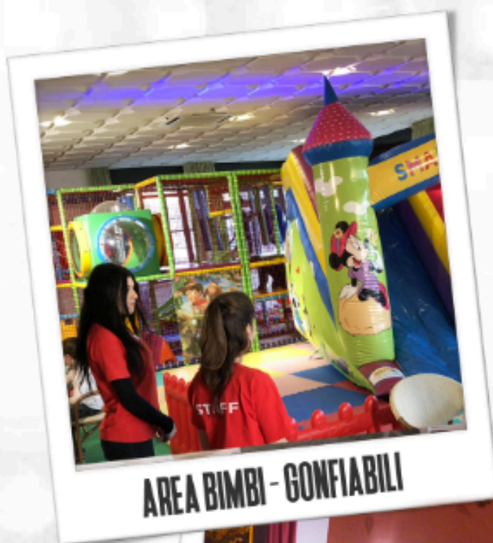
AREA BIMBI - GONFIABILI

Un ambiente unico, nel pieno centro storico di Cerveteri Da noi potrai gustare la vera cucina tipica romana e ottime pizze, il tutto con ingredienti sempre freschi e di stagione. Il nostro albergo, avrà il piacere di ospitarvi durante i vostri soggiorni turistici o di lavoro in camere confortevoli dotate di wi-fi, tv led, aria condizionata e balconcini panoramici per il vostro relax.