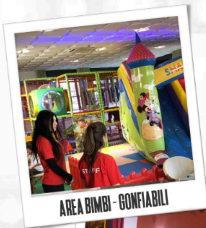
AREA BIMBI - GONFIABILI

Un ambiente unico, nel pieno centro storico di Cerveteri Da noi potrai gustare la vera cucina tipica romana e ottime pizze, il tutto con ingredienti sempre freschi e di stagione. Il nostro albergo, avrà il piacere di ospitarvi durante i vostri soggiorni turistici o di lavoro in camere confortevoli dotate di wi-fi, tv led, aria condizionata e balconcini panoramici per il vostro relax.