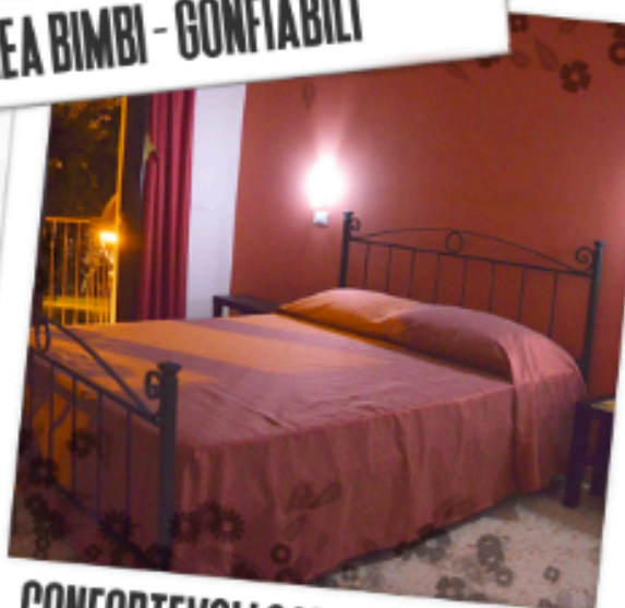
CONFORTEVOLI CAMERE D'ALBERGO