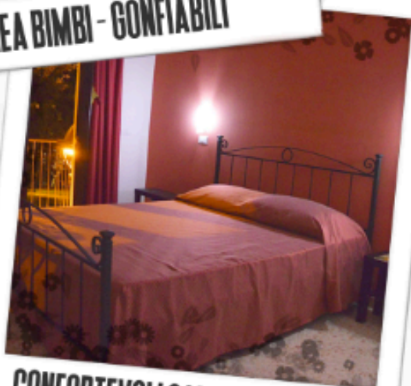
CONFORTEVOLI CAMERE D'ALBERGO