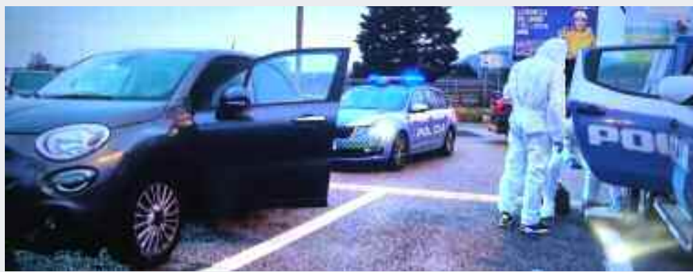
a pagina 10