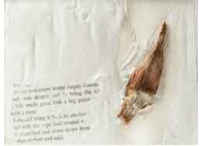
Nella foto, un'opera di Rita Mele

e germogliare. Graticci di colori ibridati, quali intrecci di lane densamente tramate, sono toccati da smagliature, in vista di impianti e talee, che circoscrivono puntiformi avvistamenti rossi; più tenui palpiti di corpuscoli cromatici, schiariti dalla luce, pulsano frammentarie ed episodiche occorrenze al di sotto della superficie la cui sagoma, dal primo piano, finge la consistenza di una lastra di calcare; e graffi che sembrano comporre sequenze di graffiti sono in procinto di una paleontologia che ha scavato nella lontana