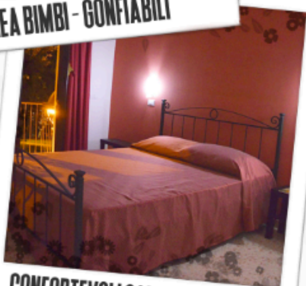
CONFORTEVOLI CAMERE D'ALBERGO