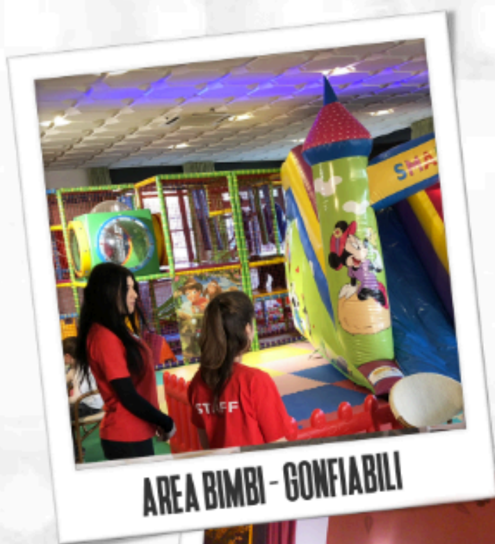
AREA BIMBI - GONFIABILI

Un ambiente unico, nel pieno centro storico di Cerveteri Da noi potrai gustare la vera cucina tipica romana e ottime pizze, il tutto con ingredienti sempre freschi e di stagione. Il nostro albergo, avrà il piacere di ospitarvi durante i vostri soggiorni turistici o di lavoro in camere confortevoli dotate di wi-fi, tv led, aria condizionata e balconcini panoramici per il vostro relax.