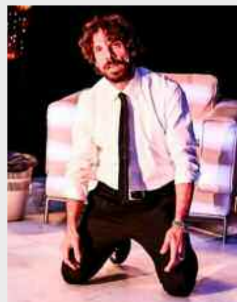
che il conflitto maggiore è interiore a ognuno di loro, tra quello che vorrebbero essere e quello che la società li costringe a diventare".

ma per diffamare direttamente il popolare giornalista che sta mettendo in crisi con le sue domande il loro leader. "La trama è tristemente attuale: politica, fake news, manipolazione dei social - sottolinea l'autore e regista Davide Sacco - Ma quello su cui ho scelto di concentrarmi sono state le motivazioni che spingono una generazione a comportarsi in maniera crudele, cattiva, bastarda. Ci sono molti conflitti in scena: il più evidente è quello tra i ragazzi e il conduttore tv, che è anche il motore principale della vicenda, nel campo di battaglia della diffusione delle notizie. Ma più andiamo avanti nella scoperta dei personaggi e più capiamo