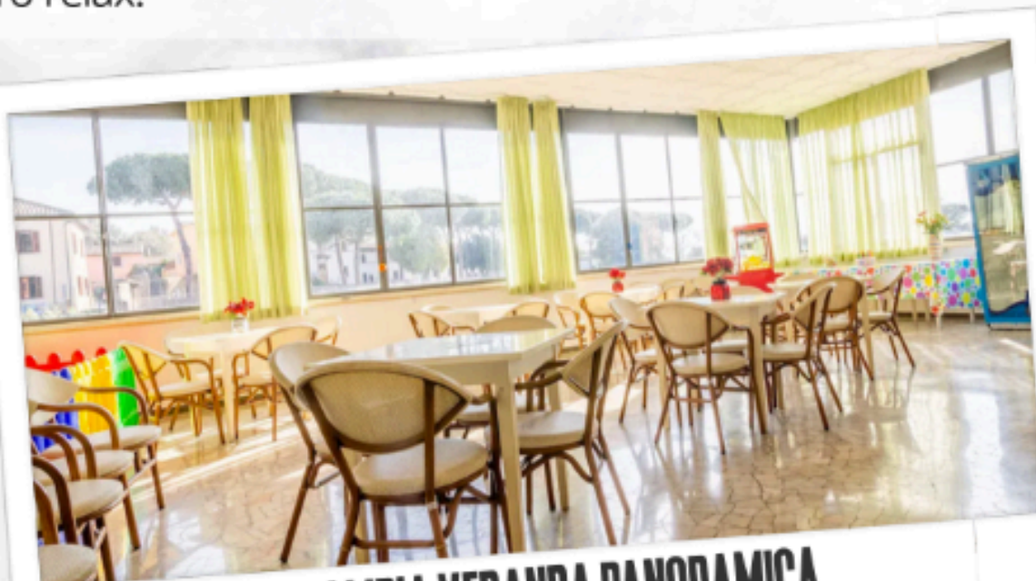
AMPIA VERANDA PANORAMICA