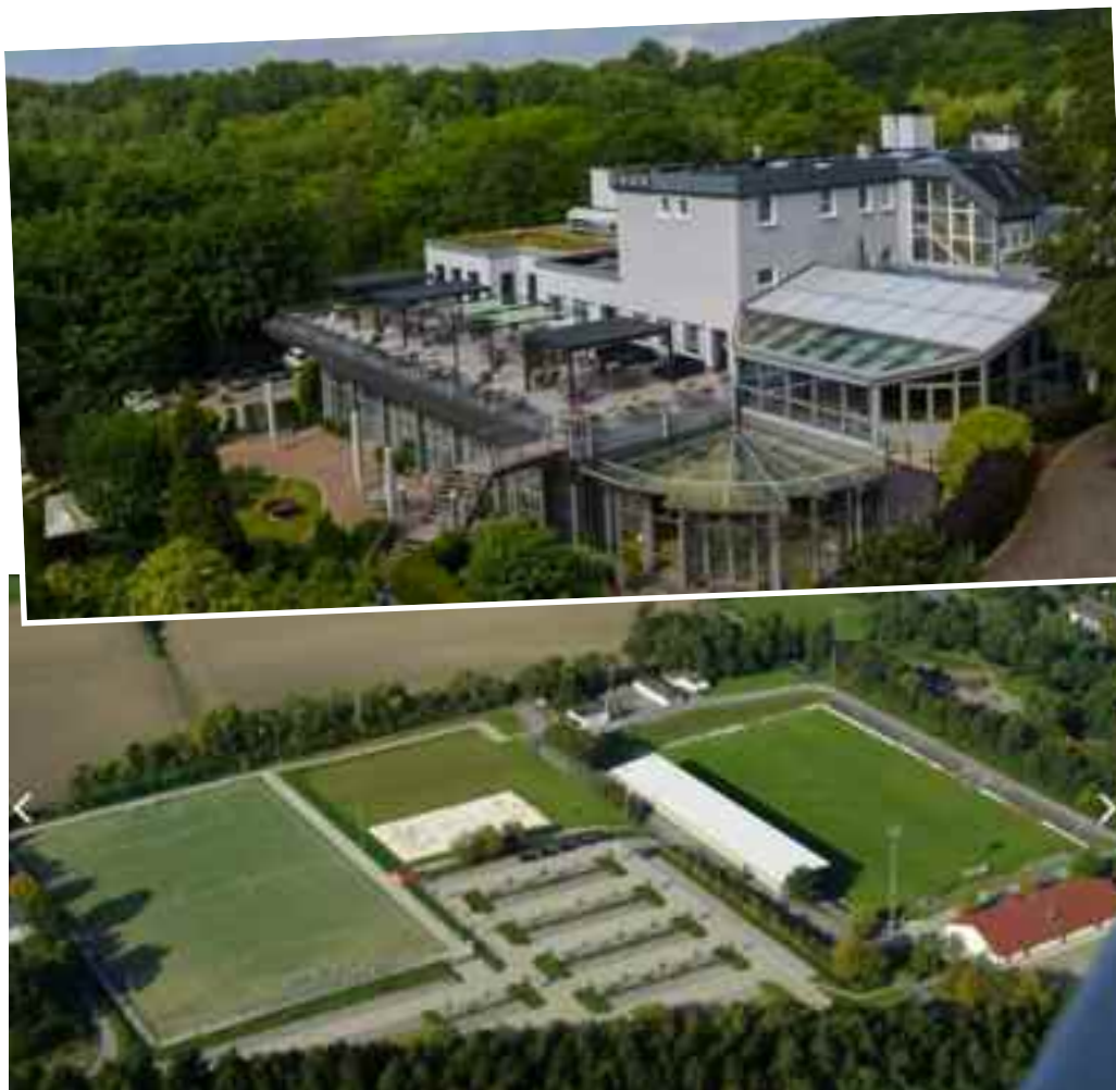
Nella foto tratte dal sito della FIGC, due panoramiche aeree dell'Hotel Vierjahreszeiten, futura Casa Azzurri

La Città - Il nome Iserlohn combina il termine lô (foresta) e ise(r)n (ferro) ed è quindi traducibile in 'foresta di ferro', minerale che nel corso dei secoli ha caratterizzato la storia e l'economia cittadina, a partire dal tardo Medioevo. Fortificata dai Conti di Brandeburgo già nel XII secolo, nel 1701 fu inglobata dal Regno di Prussia, di cui divenne una delle più importanti città industriali, fino alla metà dell'800. Nel dopoguerra, la città è cresciuta rapidamente con la costruzione di nuove aree industriali e residenziali.