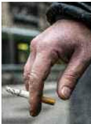
Riduzione in 150 Paesi