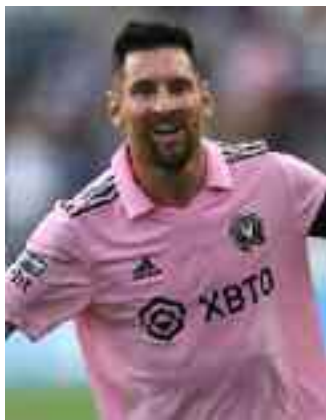
Nella foto, Lionel Messi