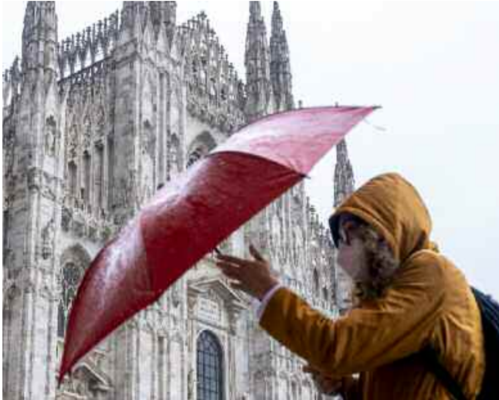
Nella foto, una delle tante e improvvise piogge che si sono stanno abbattendo sulle città italiane

Una tendenza al surriscaldamento confermata anche in Italia dove il 2023 - sottolinea la Coldiretti - si colloca ai vertici degli anni più caldi dal 2023 con la temperatura che è stata di 1,05 gradi superiore la media storica nei primi undici mesi dell'anno secondo Isac Cnr che deve ancora confermare il dato annuale dopo un dicembre comunque bollente. Un risultato che - precisa la Coldiretti - conferma la tendenza al surriscaldamento anche a livello nazionale dove la classifica degli anni più roventi negli ultimi due secoli si concentra nell'ultimo decennio e comprende fino ad ora nell'ordine secondo l'analisi della Coldiretti il 2022 il 2018, il 2015, il 2014, il 2019 e il 2020. Siamo di fronte ad una evidente tendenza alla tropicalizzazione con l'aumento delle temperature che è accompagnato in Italia da una più elevata frequenza di manifestazioni violente, sfa-