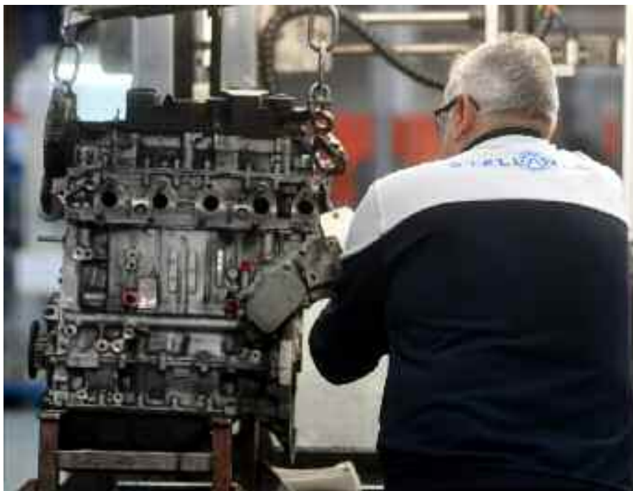
Il perdurare della crisi economica manda in tilt i meccanismi dell'industria italiana

Il comparto che nell'industria italiana ha subito la contrazione negativa del valore aggiunto più pesante in questi ultimi 15 anni è stato il coke e la raffinazione del petrolio (-38,3 per cento). Seguono il legno e la carta (-25,1 per cento), la chimica (-23,5 per cento), le apparecchiature elettriche (-23,2 per cento), l'energia elettrica/gas (-22,1 per cento), i mobili (-15,5 per cento) e la metallurgia (-12,5 per cento). Per contro, invece, i settori che esibiscono una variazione anticipata dal segno più sono i macchinari (+4,6 per cento), gli alimentari e bevande (+18,2 per cento) e i prodotti farmaceutici (+34,4 per cento). Tra tutte le divisioni, la maglia rosa è ad appannaggio dell'estrattivo che, sebbene possieda un valore aggiunto in termini assoluti relativa-