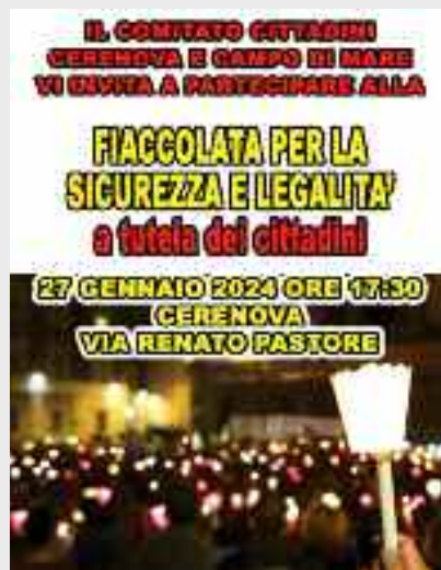
partire dalle ore 17.30 e partirà da via Renato Pastore.

zioni ed esercizi commerciali a Cerveteri, come nella vicina Ladispoli. Una situazione pesante che ha indotto, lo scorso 14 gennaio, il gruppo del controllo del vicinato a convocare un incontro proprio in seguito alla "fiammata" di furti sul territorio. Ora anche il comitato spontaneo "cittadini Cerenova e Campo di Mare" decide di far sentire la propria voce ed ha organizzato una fiaccolata della sicurezza e legalità a tutela dei cittadini. La manifestazione si terrà il 27 gennaio a