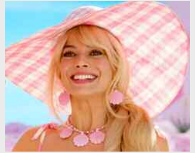
Margot Robbie, le due persone più meritevoli per questo film storico celebrato in tutto il mondo. Nessun altra persona potrebbe ottenere un premio per questo film senza il loro talento, la loro grinta e il loro genio".

America Ferrera, che interpreta Gloria, e come miglior attore non protagonista per Ryan Gosling, che interpreta Ken. Ed è stato proprio Gosling il primo ad esprimere la propria contrarietà per la decisione dell'Academy di escludere Robbie e Gerwig dalle singole categorie: "Non esiste Ken senza Barbie, e non esiste un film su Barbie senza Greta Gerwig e