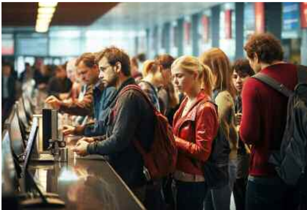
Per gli italiani torna l'incubo "fila" tra pubblica amministrazione e ospedali

Tra il 2021, anno in cui ci trovavamo in piena crisi pandemica, e il 2023, primo anno post Covid, le persone che si sono recate presso una ASL sono aumentate del 12,9% (+2.246.000 persone), mentre quelle in attesa da più di 20 minuti sono incrementate del 24,4% (+1.926.000 persone).