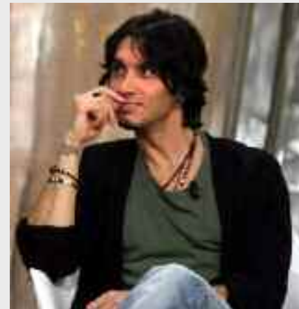
Nella foto un giovane Moro

Villa Bellini 29 agosto - Palermo - Teatro di Verdural biglietti per le nuove date saranno disponibili in prevendita dalle ore 18.00 di oggi, venerdì 1° marzo, su TicketOne.it e nei punti vendita e nelle prevendite abituali. Durante i live, Fabrizio Moro emozionerà il pubblico, accompagnandolo in un viaggio musicale attraverso tutti i brani più rappresentativi del suo percorso artistico (info: www.friendsandpartners.it ). Sul palco sarà accompagnato da: Danilo Molinari e Roberto "Red" Maccaroni alle chitarre, Luca Amendola al basso, Alessandro Inolti alla batteria e il Maestro Claudio Junior Bielli al pianoforte.