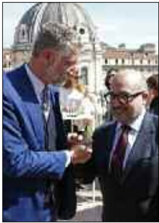
Alessandro Giuli, Presidente Fondazione Maxxi, con il Ministro Gennaro Sangiuliano

Sono necessarie azioni mirate alla valorizzazione delle donne e al raggiungimento di una piena parità di genere sia nell'occupazione sia nella crescita professionale