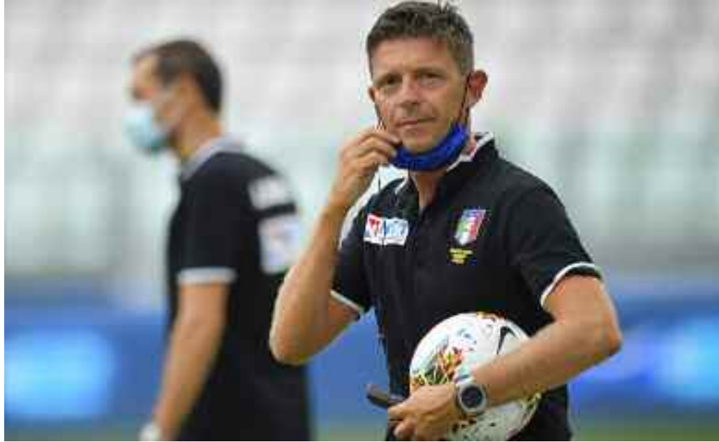
Nella foto, l'arbitro Gianluca Rocchi poco prima del suo ultimo match

Il primo episodio 'chiama in campo' una delle materie più difficili per la categoria arbitrale e per il calcio in generale, poiché si porta dietro una parte di soggettività di interpretazione: il fallo di mano. Nel corso della puntata, vengono analizzate caso per caso alcune situazioni legate al fallo di mano, partendo dalle tre categorie di infrazione: il contatto mano/palla intenzionale, il contatto mano/palla non intenzionale con posizione innaturale di mano o braccio, finendo con i gol segnati con mano o subito dopo un contatto accidentale mano/palla di chi segna. Uno