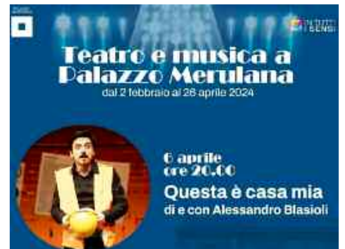
Nella foto, la locandina dell'evento a Palazzo Merulana

#1 IL PRIMO RISTOFAMILY DEL LITORALE NORD