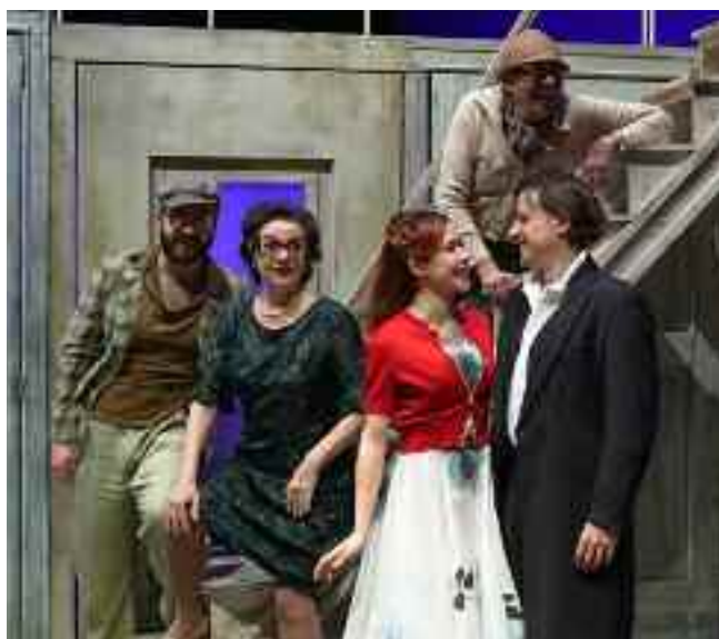
Nella foto, un'immagine di scena