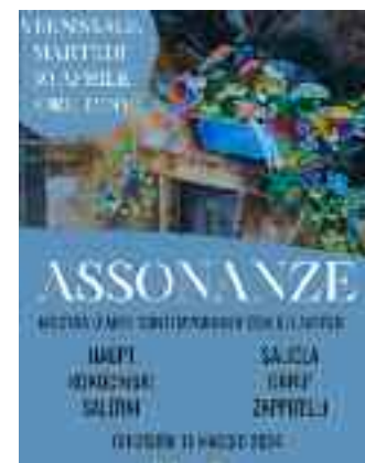
Nella foto, la locandina dell'evento