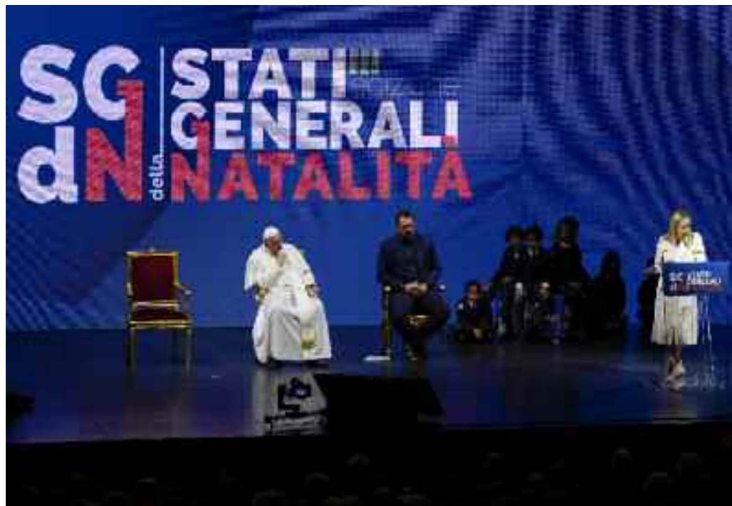
Conferenza sulla natalità, all'Auditorium della Conciliazione, a Roma a maggio 2023

Il Sinodo, per avere successo, ha bisogno del contributo fattivo dei parroci, vera e propria colonna vertebrale della Chiesa. I parroci, per poter contribuire al percorso della sinodalità, sappiano condividere il lavoro tra loro e con i vescovi, come anche valorizzare l'apporto del laicato. Lo scrive Papa Francesco in una lunga lettera consegnata questa mattina nel corso dell'udienza ai partecipanti all'Incontro Internazionale dei Parroci, dedicato al processo sinodale in corso. «La Chiesa non potrebbe andare avanti senza il vostro impegno e servizio», scrive il Pontefice ai titolari delle parrocchie convenuti a Roma in questi due giorni, «per questo voglio anzitutto esprimere gratitudine e stima per il generoso lavoro che fate ogni giorno, seminando il Vangelo in ogni tipo di terreno». I parroci «conoscono dal di dentro la vita del Popolo di Dio, le sue fatiche e le sue gioie, i suoi bisogni e le sue ricchezze», prosegue, «Per questo una Chiesa sinodale ha bisogno dei suoi Parroci: senza