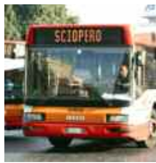
Coinvolte le reti Atac, Roma Tpl e ATI Lunedì sciopero Trasporti pubblici a rischio