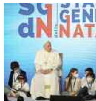
Appuntamento il 10 maggio all'Auditorium Conciliazione Il Papa presente agli Stati Generali della Natalità