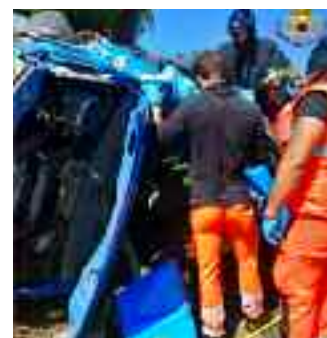
L'incidente ha coinvolto un bus di turisti Violento scontro in Autostrada Grave l'autista di un furgone