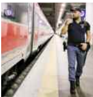
Tre arresti e 17 denunce nell'ultima settimana Stazioni Fs nel mirino Il bilancio della Polizia

donna un cellulare. È stato mentre la vittima del furto chiedeva aiuto, allarmando il personale di stazione, che il giovane ha scavalcato il suddetto cancello. Le 300 persone a bordo del convoglio sono state trasferite su un altro treno. Il tragico incidente ha provocato ritardi nel corso della mattinata sulle linee che transitano sui binari interessati. Alle 13:30 la circolazione dei treni, bloccata fino a quel momento, è tornata alla regolarità. Per permettere i primi rilievi sul corpo e le prime indagini, ci sono stati rallentamenti fino a 10 minuti per dodici treni alta velocità, tra i 10 e i 40 minuti per cinque intercity e 48 regionali e due i regionali limitati. Undici in totale, invece, quelli cancellati.