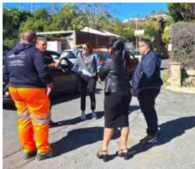
Nella foto, il vicesindaco durante il sopralluogo per la chiusura del Ponte Vignacce

pazientare e comprendere che la nostra città ha una morfologia tale da rendere difficile la circolazione. Soprattutto quando si chiude un ponte che collega due quartieri al centro e alla statale, non abbiamo grandi alternative. Abbiamo calendarizzato tutti i lavori programmati, ma poi accadono anche i guasti imprevisti e la necessità di porvi subito rimedio. Come Amministrazione siamo impe-