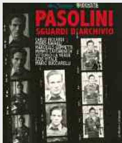
Nelle foto della locandina Pier Paolo Pasolini ritratto nel suo appartamento di Via Eufraate a Roma nel 1974

le di una cultura di condivisione tra colori diversi ed emozioni che entrano profondamente nell'anima di chi le si avvicina». Dunque, un concerto imperdibile per tutti gli amanti della buona e vera musica che intendono intraprendere un viaggio immersivo dalle alte frequenze emozionali.