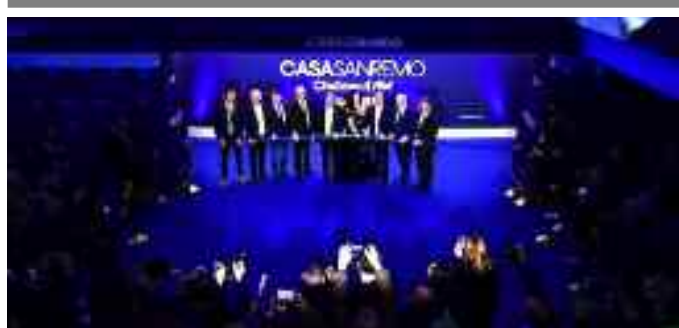
Il taglio del nastro di PalatItalia Enit

riporta infine la vicenda entro i confini del mito, prefigurando l'immortalità di Elena e il destino beato di Menelao. Una proposta che promette di restituire al pubblico la modernità e la complessità di un testo capace, ancora oggi, di interrogare il confine sottile tra ciò che appare e ciò che è.