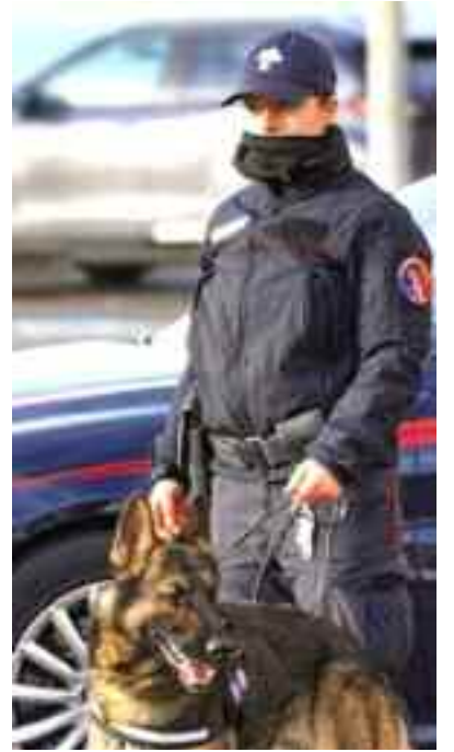
manico, a scatto e arnesi da scasso - e di quattro soggetti per detenzione ai