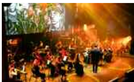
Nella foto, l'orchestra “Lords of the sound”

Con il titolo “The Music of Ennio Morricone”, l'orchestra sinfonica “Lords of the sound”, il prossimo 26 aprile alle ore 17.00 si esibirà in concerto all'Auditorium Paganini di Parma. Sul palco più di 50 artisti (solisti e un suggestivo ensemble vocale) per un grande tributo sinfonico dedicato al Maestro Ennio Morricone, genio indiscusso della musica da film. Orchestra sinfonica di fama internazionale capace di trasformare ogni concerto in un evento mozzafiato. Attivi da circa dieci anni, i Lords of the Sound hanno rivoluzionato il concetto stesso di performance orchestrale, unendo alla perfezione dell'esecuzione sinfonica, scenografie d'impatto ed effetti visivi spettacolari grazie