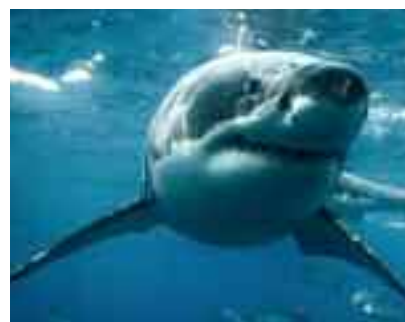
barca d'appoggio quando lo squalo lo ha morso alle gambe, provocando

Un uomo di 38 anni è morto dopo essere stato attaccato da uno squalo al largo dell'isola di Rottnest, una delle mete turistiche più note della costa sud occidentale dell'Australia. Secondo quanto riferito dalla polizia locale, la vittima stava praticando pesca in apnea insieme a un amico quando è stata aggredita nei pressi di una barriera corallina. Il sergente della polizia dell'Australia Occidentale Michael Wear ha spiegato che l'uomo si trovava vicino alla