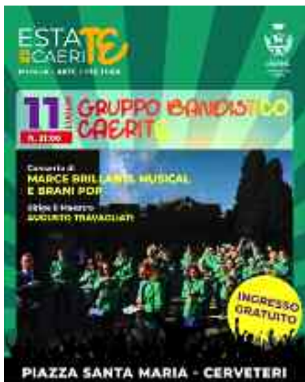
un Gruppo Bandistico che più passano gli