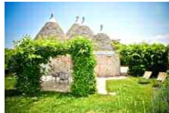
Nella foto, uno scorcio del "Leonardo Trulli Resort" dove saranno collocate alcune opere

una riflessione diversa. La materia si fa origine, la memoria diventa radice, la vita chiede protezione, l'uomo ritrova la propria fragilità, la danza apre alla libertà e il cosmo riconduce ogni cosa a un ordine più grande". Integrandosi con naturalezza negli ambienti del Resort, le opere in esposizione "accompagnano lo sguardo in una dimensione più raccolta, dove le forme scultoree e la forza del colore invitano a rallentare, osservare e riconoscere la complessità delle emozioni umane ... un invito a risve-